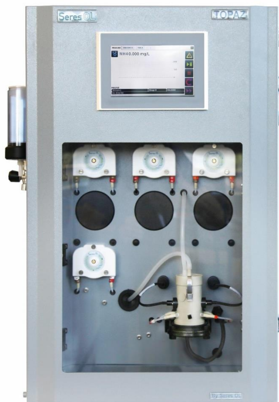
Seres OL Topaz Séries

Menu simple et intuitif en anglais ou en français.